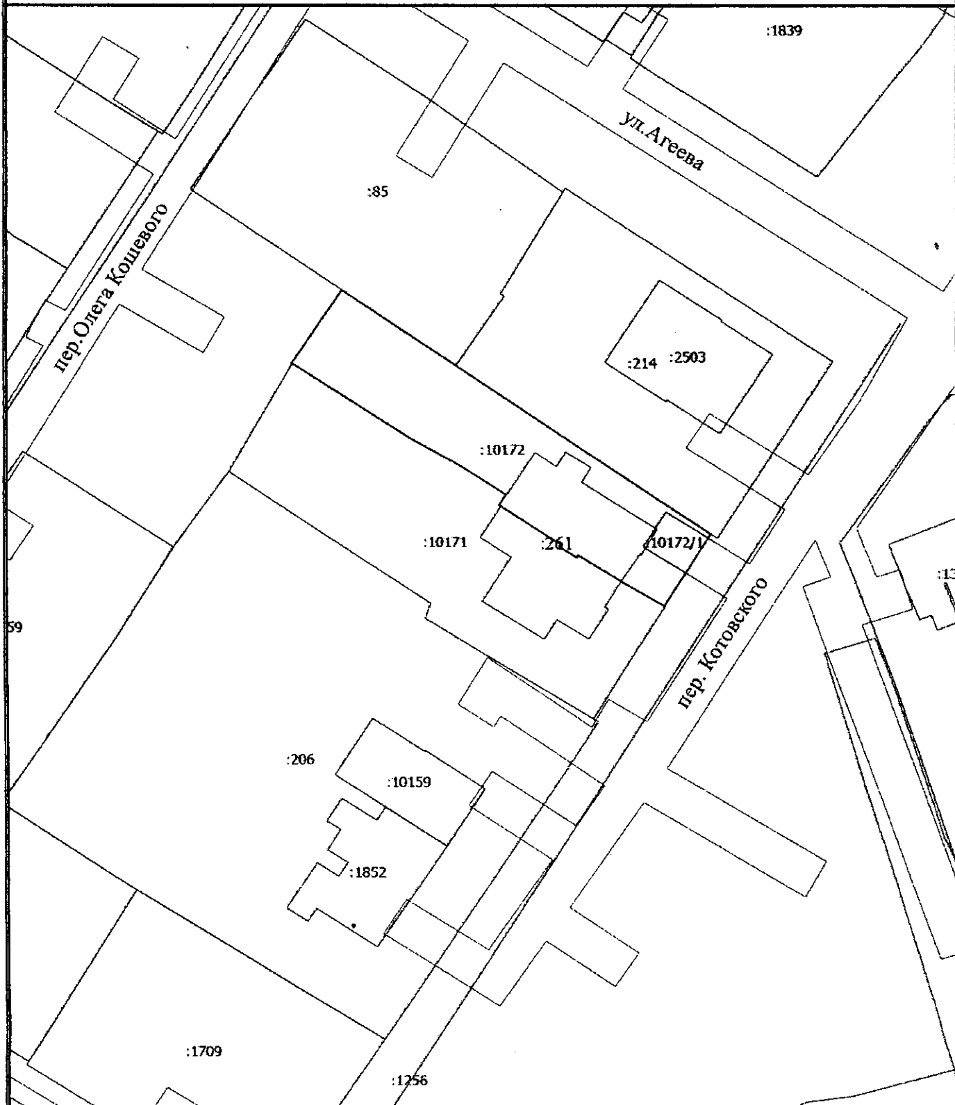
Схема организации земельного участка